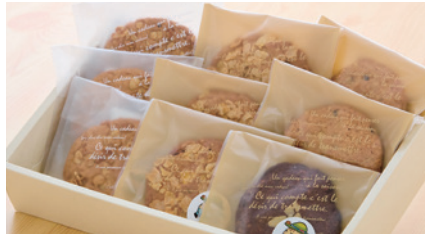
商品番号 S-03 みさ坊?クッキーセット (3種12枚入り)