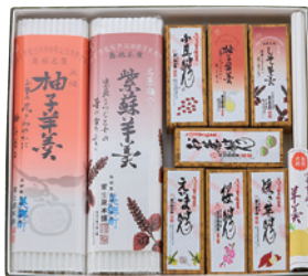
商品番号 F-03 羊羹詰め合わせセット 「美郷の四季C」