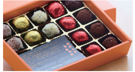
商品番号 S-01 柿シヨコラ