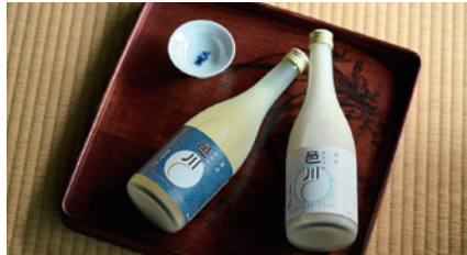
商品番号 D-01 濁酒邑川 青・白ラベル (720ml) 2本セット