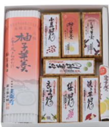
商品番号 F-02 羊羹詰め合わせセット 「美郷の四季B」