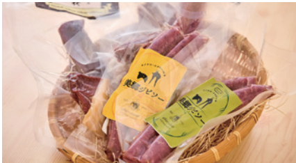
商品番号 M-01 地ビソ- & 燻製セット