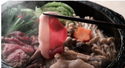
商品番号 O-03 猪すき焼き & 猪ハンバーグセット