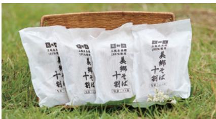
商品番号 Y-01 美郷そば 十割