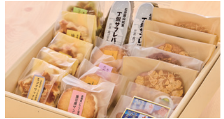
商品番号 S-04 オリジナル焼き菓子セット