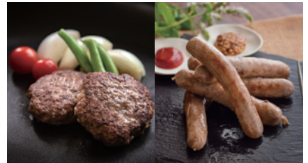
商品番号 O-02 猪ハンバーグ & ソーセージセット