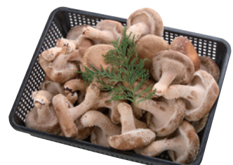
商品番号 N-01 菌床椎茸肉厚セット