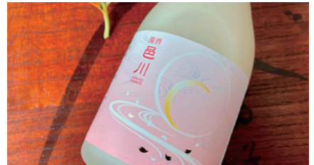
商品番号 D-02 濁酒邑川 SAKURAラベル (300ml) 3本セット