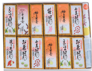
商品番号 F-01 羊羹詰め合わせミニセット 「美郷の四季A」