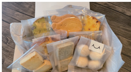
商品番号 K-01 焼菓子詰合せ