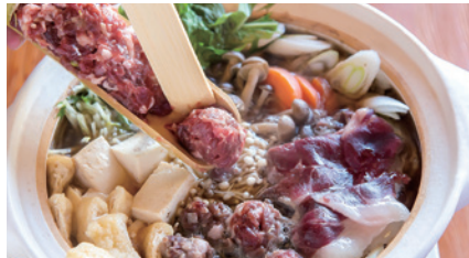
商品番号 O-01 猪鍋セット (山椒つくね入り)